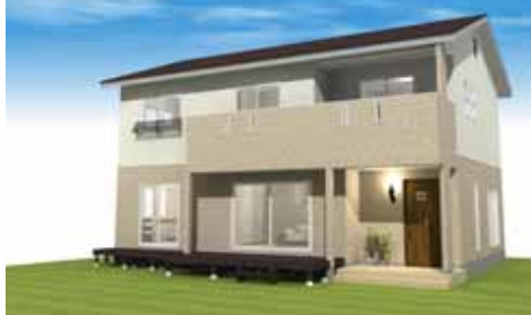
外観イメージパース

8 / 3 土 ・ 8 / 4 日 10:00 ~ 17:00 (雨天決行) 今回の見学会は 予約制 です!