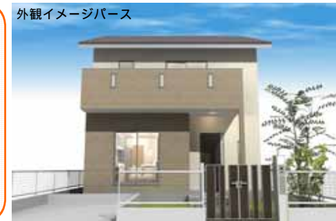
外観イメージパース

7月27日(土)・28日(日)に、名古屋市北区にて、完成現場見学会を開催いたします。今回は吹付け断熱の家「平成の家」です。和室とひと続きの開放感抜群のLDK、2F廊下の造作本棚、ロフトなど、見どころ満載です。家具や小物のコーディネートも行いますので、部屋の大きさや家具レイアウトなどこの家での暮らしを体感して下さい！「暮らしを提案する」平成建設の家をぜひこの機会にご覧下さい。今回の見学会は予約制です。たくさんのご予約をお待ちしております！！