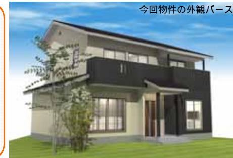
今回物件の外観パース

7月9日(土)・10日(日) 清須市にて完成見学会を開催します。今回の物件は、自然素材と外断熱の家「日々木」です。無垢材+外断熱の快適さをご体感いただける絶好の機会です。こだわりの本格和室やアイランド型キッチン、量収納ユニットなど、見どころ満載です。当日は家具・小物のコーディネートも行いますので、部屋の大きさや家具のレイアウトなど、実際のこの家での暮らしを体感して下さい！！「暮らしを提案する」平成建設の家を、ぜひこの機会にご覧下さい。