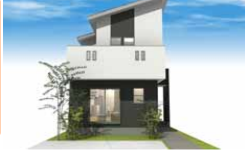
外観イメージパース

12/7 土 ・ 12/8 日 10:00~17:00 (雨天決行) 蓄熱暖房の効果を体感下さい!