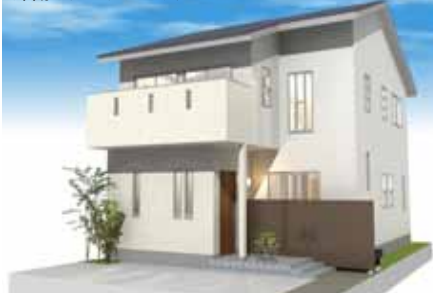
外観イメージパース

12月8日(土)に、名古屋市北区にて完成現場見学会を開催します。第3弾の物件は、桧&赤松の無垢床材の中にアルミ階段がアクセントの「ナチュラルモダンスタイル」の吹付け断熱の家「平成の家」です。見学会当日は、家具・小物などのコーディネートも行いますので、部屋の大きさや家具の配置など、実際のこの家での暮らしをご体感下さい! 「暮らしを提案する」平成建設の家を、ぜひこの機会にご覧下さい。今回も 予約制 となります。ご予約お待ちしております。